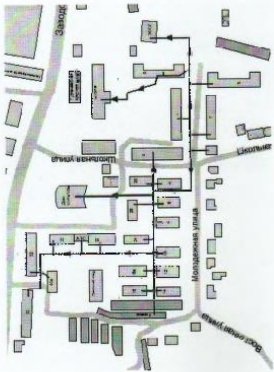
Рисунок 1.1 - Зона действия котельной по ул. Школьная, Га